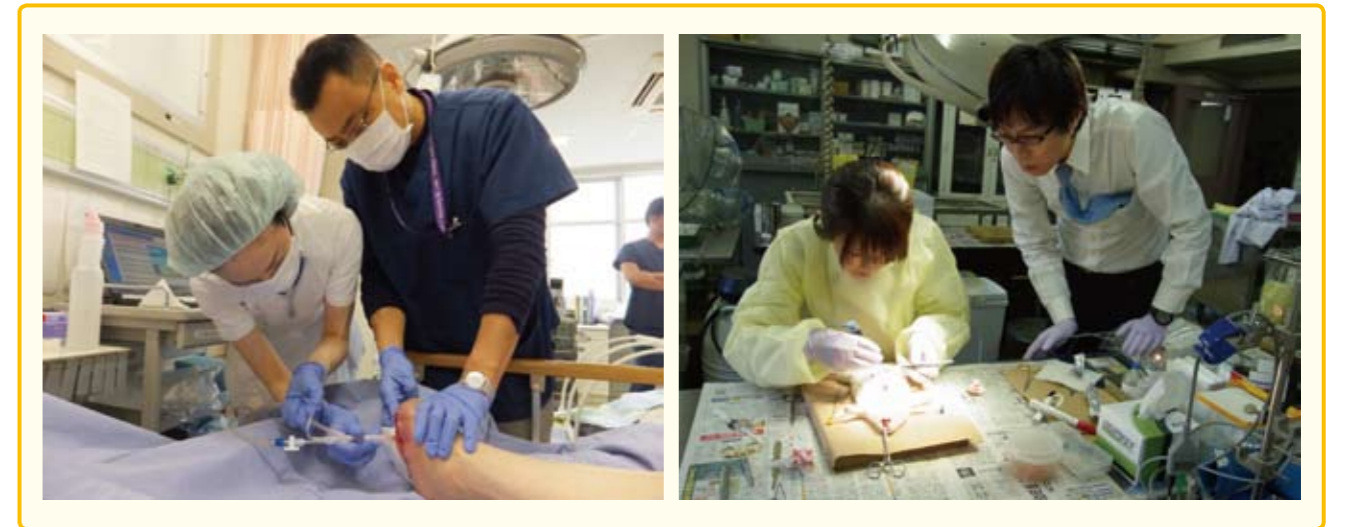
図3 医行為の演習や実習 医師の直接指導のもとに行われた