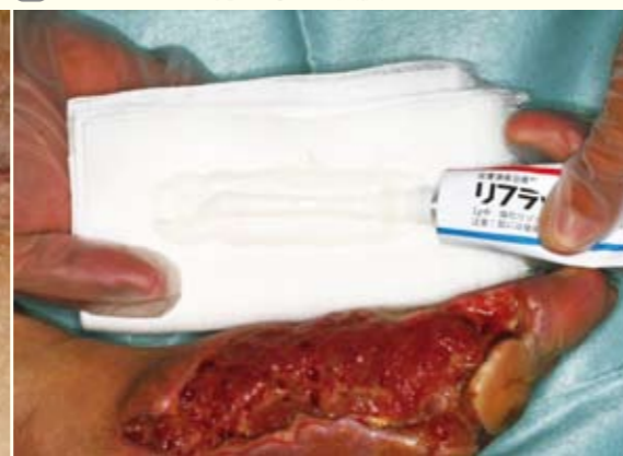
B リフラップ ® 軟膏を用いた被覆