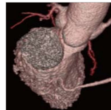
表紙イラスト/齋藤州一