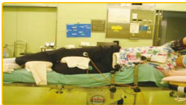
図5 側臥位：呼吸器外科手術