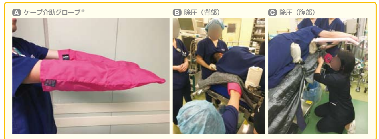
図7 すれ力改善に用いる滑る手袋（ケーブ介助グローブ®）とその実際 ケーブ介助グローブ®を使用。側臥位では背部からと腹部からのすれ力改善のトレーニング風景