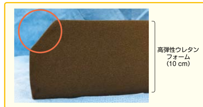
図8 当院特注の面取り手術マット（高弾性ウレタンフォーム10CM）

パークベンチ体位のようなベッドから患者の身体をせり出して，腋窩に荷重がかかる側臥位をとる際には，左のような底つきしない高弾性ウレタン製の面取りした特注マットレスを使用している