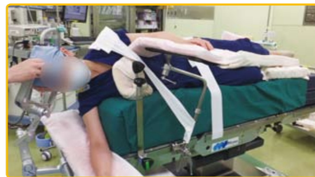
図6 側臥位：脳神経外科