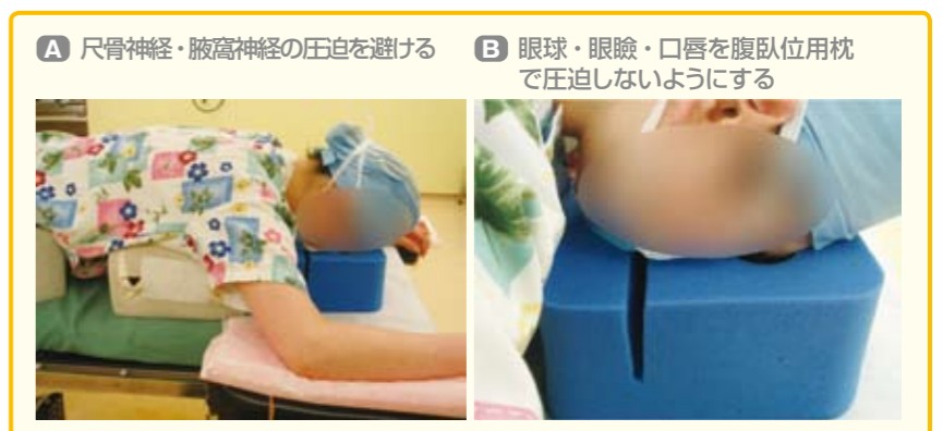
図10 腹臥位のポイント①