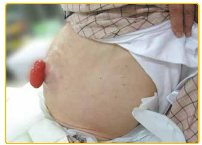
図2 腹水による腹部膨満のある事例 腹壁の形状は凸状になっている

るいそうに至る原因として、栄養摂取量の不足や消化吸収障害、内分泌・代謝障害、エネルギー消費などがあり 1) 、その結果、程度にはありますが体重減少がみられます。がん患者では、悪液質を含むがんの病態によるものや、手術・化学療法・放射線療法などががん治療の副作用などによって体重減少を生じることがあり、がん患者の体重減少は30～80%の確率で見られるといわれています 2) 。よってがん患者のるいそうは、がん終末期に限らずさまざまな時期に生じることがあります。