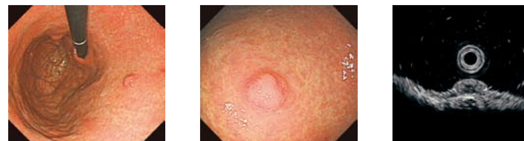
体中部前壁に軽度発赤調の隆起性病変を認める。EUSでは第1・2層を主座とする境界明瞭で均一な低エコー像を呈する。