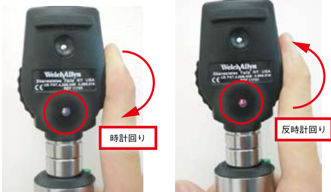
緑色の数字（凸レンズの度数）が変化 赤色の数字（凹レンズの度数）が変化

眼底鏡を使用するたびに毎回合わせる必要がないように、いったん自分の視力にレンズを合わせたら、そのときのレンズ度表示窓の数字を覚えておくとよい。