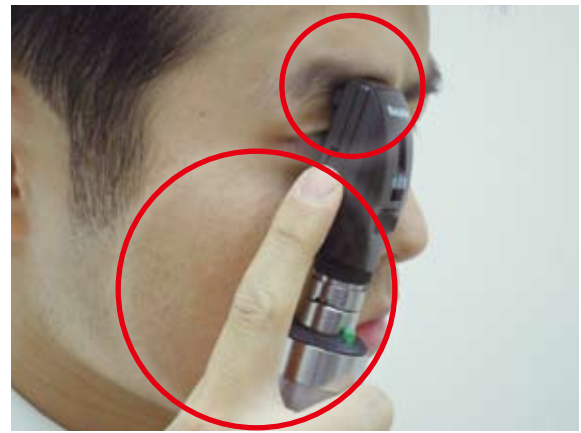
図3 眼底鏡を自分の顔面に固定

スイッチを入れたら、のぞき孔を通してのぞいてみよう。眼鏡ははずして使用する。このとき大切なことは、眼底鏡を保持した手を自分の頬部に、さらには眼底鏡上部の眉当て部分を自分の眉部に密着させ、視度調節ダイヤルを回しても眼底鏡がぶれないように、2箇所での自分の顔面にしっかりと固定することである（ 図3 ）。右眼だけでなく、左眼でも同じように安定した操作ができるようにしたい（このときは左手で眼底鏡を保持する）。